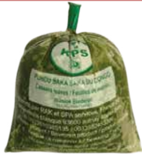
SAKA SAKA 20X500G