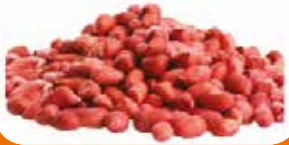
ARACHIDE GAROUA GRAIN 1KG