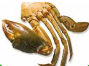
CRABE MADAGASCAR P 12X1KG