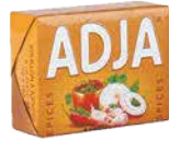
ADJA BOUILLON TABLETTE 12X60X10G