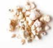
BAOBAB GRAIN DE SINGE 10X100G