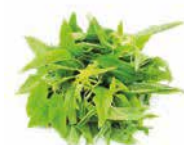
BITEKU TEKU 5KG / 10KG