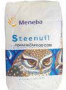
SEMOULE BLANCHE MENEBA 25KG