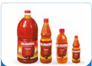
HUILE DE PALME VILLA-GEOISE 50CL/75CL