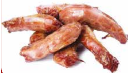
COU DE DINDE FUME HALAL 4X2KG