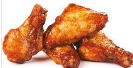
AILE DE DE POULET TEX MEX 2X2.5KG