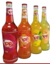
TOP CAMEROUN 12X65CL