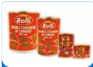
TOMATE CONCENTRE ROLLI 440G/880G