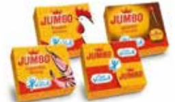
JUMBO TAB 24X600G