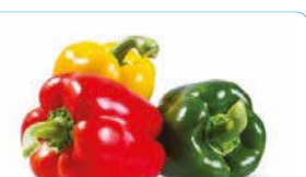
POIVRON ROUGE / VERT