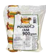
POUDEE YAM 10X900G