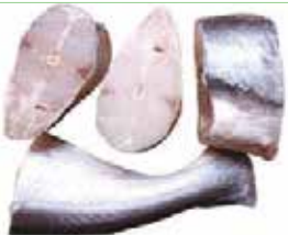
DARNE MALANGUA 10X800G