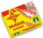
CUBE MAGGI CREVETTE 24X600G