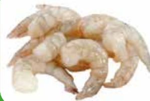
QUEUE DE CREVETTE DECORTIQUEE 31/40 25X320G