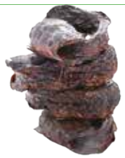
POISSON CHAT FUME INDONESIE 5KG