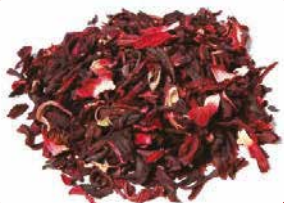
FLEUR BISSAP SEC ROUGE 100G / 250G / 500G / 1KG