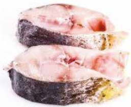
DARNE DE DORADE 12X800G