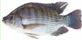
TILAPIA 500/800 3.2KG