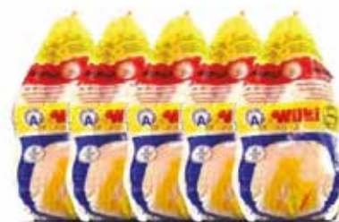
POULE WILKIE 1.2KG/ 1.3KG/1.4KG/1.5KG