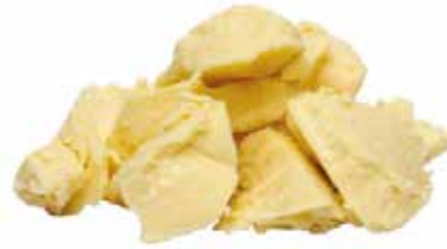
BEURRE DE KARITE 10X100G