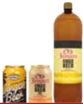
GINGER BEER 33XL / 50CL/1.5L