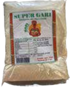
GARI BLANC TOGO 1KGX15