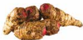
MACABO ROUGE 10KG