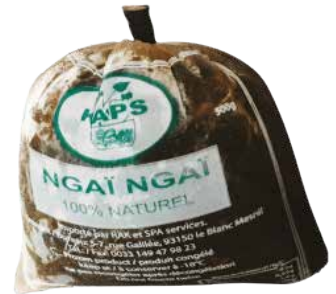
NGAI NGAÏ 20X500G