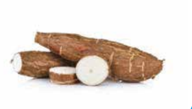
MANIOC COSTA RICA 18KG