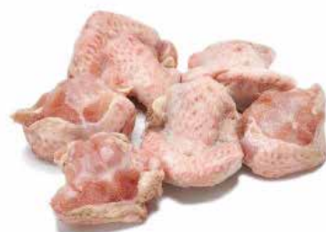
CROUPION DE DINDE HALAL 10X1KG NATURE