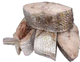
DARNE CAPITAINE 12X800G