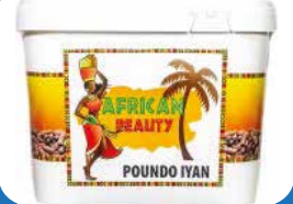
POUNDED YAM 4KG