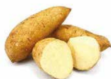
PATATE BLANCHE 10KG