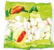
BONBON ALOCOOLISE VERT