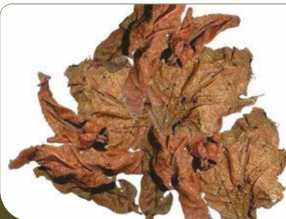
FEUILLE DJEKA 100G