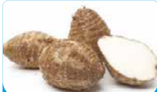
MACABO BLANC 10KG