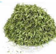
FOUMBOIS FRAIS 1.5KG