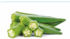
GOMBO HONDURAS 5KG