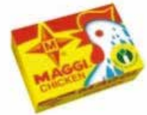
CUBE MAGGI POULET 24X600G