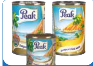
LAIT PEAK 170G/ 410G