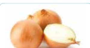
OIGNONS JAUNE 5KG