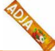
ADJA BOUILLON STICK 4X60X12G