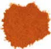
POUDRE PIMENT KANKANKAN 10X100G