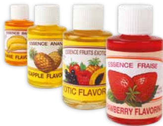
AROME ESSENCE 3 LIONS