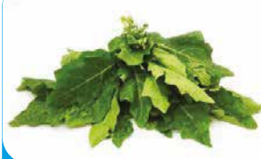
GBOMA FRAIS 5KG/10KG