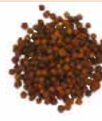
GNAN GNAN GRAIN 10X100G