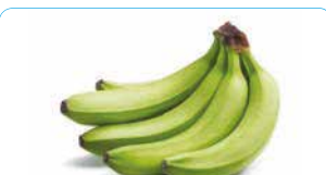
BANANE VERTE COLOMBIE