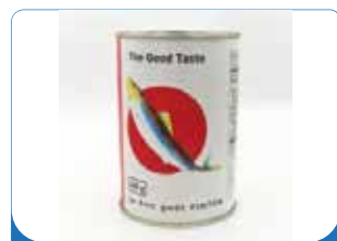
SARDINELLA PINTON 380G