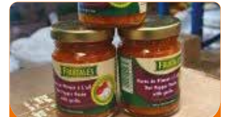
PUREE PIMENT AIL 24X100G