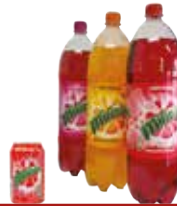
MIRINDA 2L / 33CL