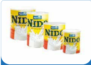
LAIT NIDO 400/900G/1.8KG/2.5KG