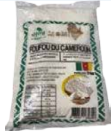
FUFU CAMEROUN 1KGX15