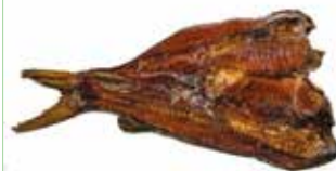
MACHOIRON FUME KOEPILA 5KG