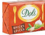
DOLI EPICE 12X60X10G