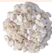
MBIKA GRAIN PISTACHE