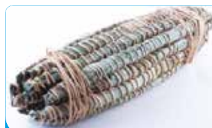
MIONDO FRAIS 20X1KG