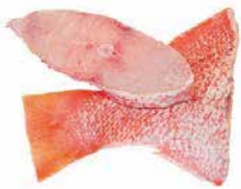
DARNE DE VIVANEUX 12X800G