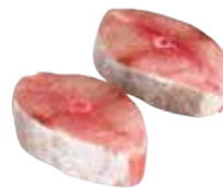
DARNE THON GARBA 6X1KG