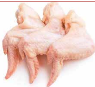
AILE DE POULET 10KG