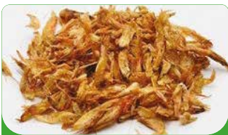
WHOLE CRAYFISH 15X50G