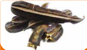
CHAMPIGNON NOIR AFRICAIN 10X100G