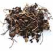
CHAMPIGNON NOIR AFRICAIN 10X100G