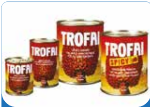
SAUCE GRAINE TROFAI 400G/800G