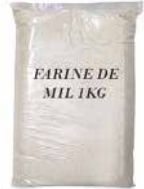
FARINE MIL 1KGX20