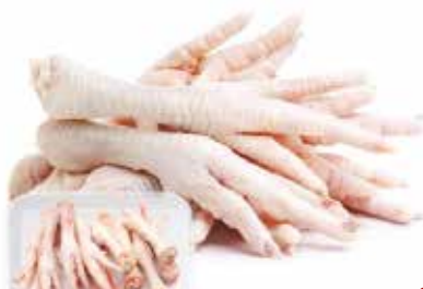
PATTE DE POULET 10KG