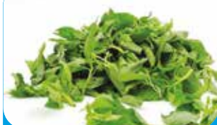
LALO FRAIS 5KG / 10KG