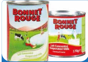
LAIT BONNET ROUGE 410G/170G