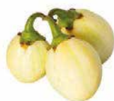
AUBERGINE BLANCHE 5KG