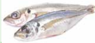
CHINCHARD CHILI 900 + 20KG