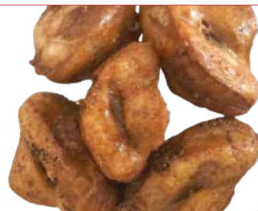
CROUPION DINDE FUME HALAL 8X1KG