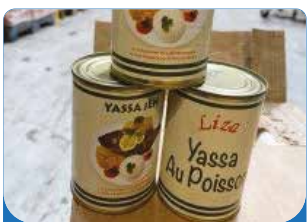
SAUCE YASSA POISSON 400G