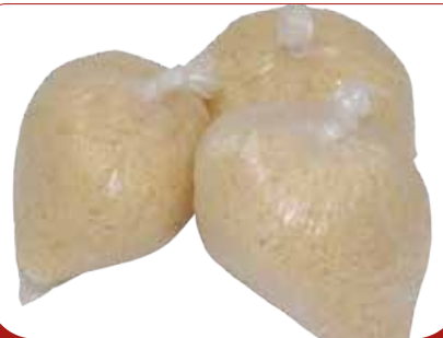
ATTIEKE CONGELE 20X500G