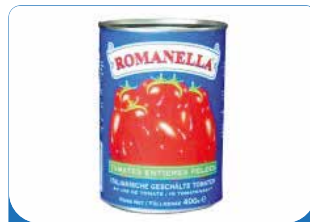
TOMATE PEELE ROMANELLA 400G/800G