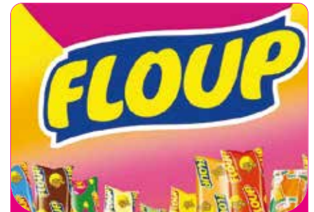
FLOUP LAIT / FLOUP SIROP