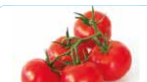
TOMATE GRAPPE OU RONDE