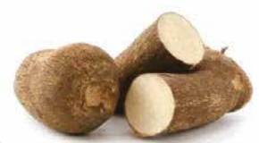
IGNAME PUNA / BLANC GHANA 20KG