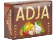
ADJA SUPER TABLETTE 12X60X10G