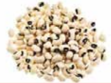
HARICOT KOKI CAMEROUN 1KG