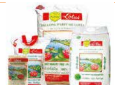
RIZ LONG THAI LOTUS 1KG/5KG/10KG/20KG