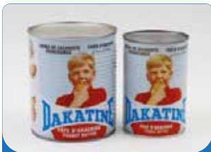
PATE ARACHIDE DAKATINE 425G/850G