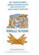
SEMOULE BLANCHE YA PEMBE 5KG