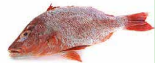
VIVANEUX 2000/3000 20KG