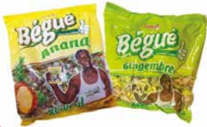
BONBON BEGUE GINGEMBRE/ANANAS