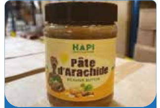
PATE ARACHIDE HAPI 500G/ 2KG/ 4KG