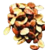
AMANDE MANDE SIOKO 10X100G