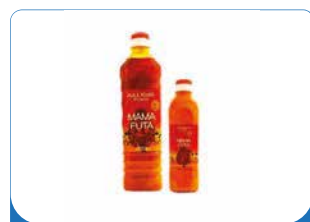
HUILE DE PALME MAMA FUTA 50CL/75CL/1L