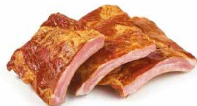
COTIS DE PORC FUME 10X1KG