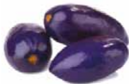
SAFOU CAMEROUN 5KG