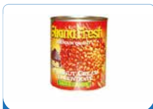
GHANA FRESH 400G/800G