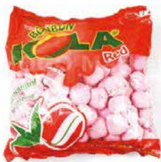
BONBON ALOCOOLISE ROUGE ANANAS