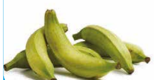
PLANTAIN COLOMBIE VERT