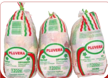
POULE PLUVERA 1.2KG/ 1.3KG/1.4KG/1.5KG