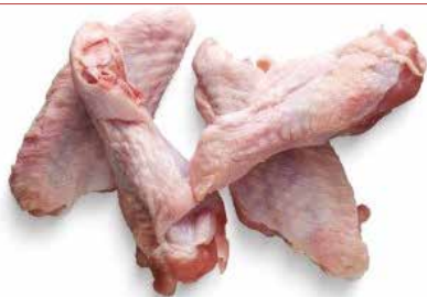
AILERON DE DINDE NATURE HALAL 12X1KG