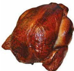
POULE FUME ENTIERE HALAL/KG