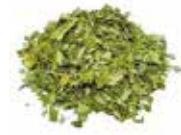
FEUILLE MORINGA 10X100G