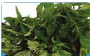
MATEMBELE 5KG 5KG / 10KG