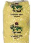
FARINE MAIS JAUNE 1KGX12