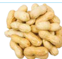
ARACHIDE TOGO 5KG