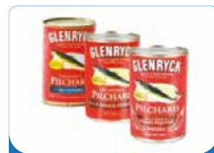
PILCHARD GLENRYCKS 425G