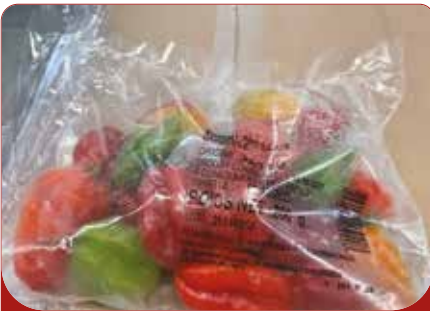
PIMENT CONGELE 25X200G