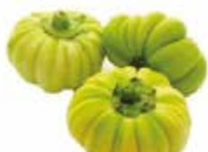
DIAKATOS BURKINA 5KG