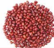
HARICOT ROUGE CAMEROUN 1KG