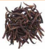
POIVRE LONG NOIR 10X100G