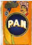
FARINE MAIS BLANC PAN 1KGX10