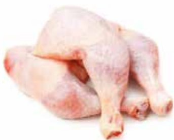
CUISSE DE POULET HALAL 10KG