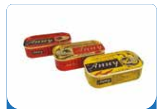
SARDINE ANNY 50X125G