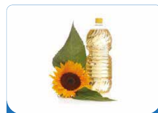
HUILE TOURNESOL 1L / 5L