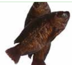
TILAPIA ENTIER FUME 5KG