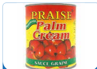
SAUCE GRAINE PRAISE 400G/800G