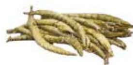
BOBOLO FRAIS 2X3X300G