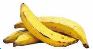
PLANTAIN COLOMBIE TOURNANT