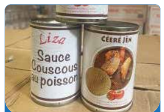
SAUCE COUSCOUS POISSON 400G