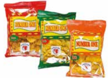
CHIPS NUMBER ONE DOUX / SALE/ EPICE 20X85G