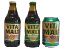
VITAMALT CLASSIC / GINGEMBRE 24X33CL