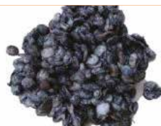
SOMARA GRAIN 10X100G