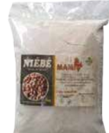
FARINE HARICOT 10X900G