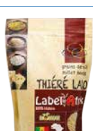
THIÈRE LALO 30X450G