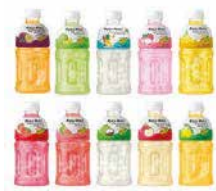
JUS MOGU MOGU