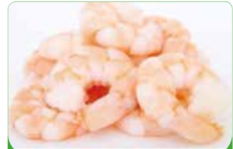
CREVETTE DECORTIQUEE CUITE 31/40 10X1KG