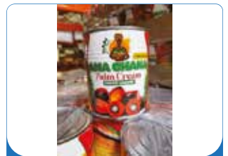
SAUCE GRAINE MAMA GHANA 400G/800G