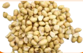
ARACHIDE NDOLET GRAIN 1KG